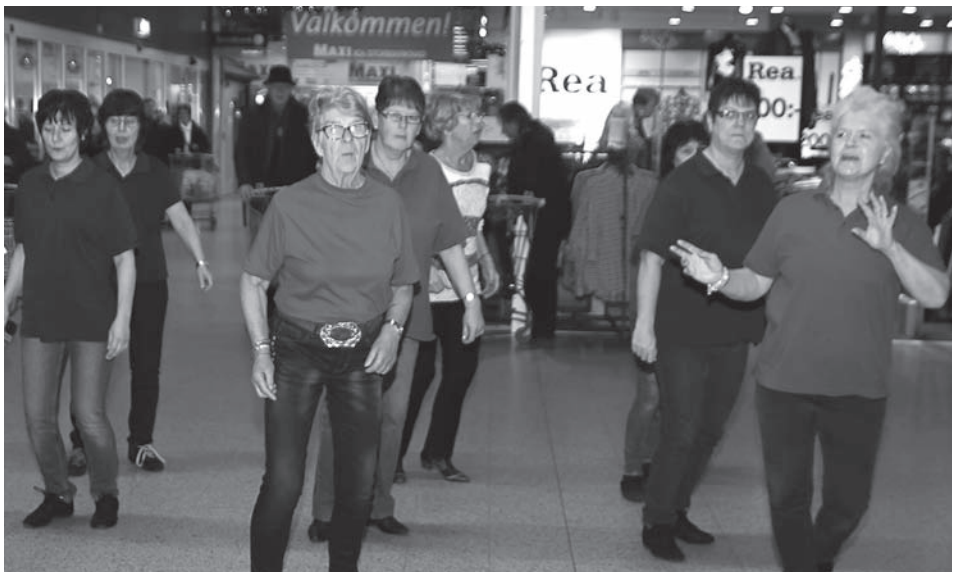
Linedansarna visade prov på sina danser.