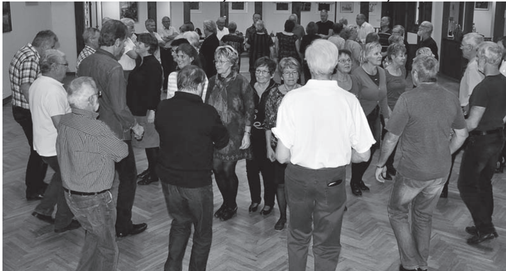
Gilledansarnas båda grupper, "Jämjögruppen" och "Danssmedjegruppen", träffas två gånger varje termin hos varandra och då är det "liv i luckan" med härlig dansglädje och gemenskap.

Det tar lite på krafterna, men så roligt! Och våra nybörjare (som inte längre är ny-