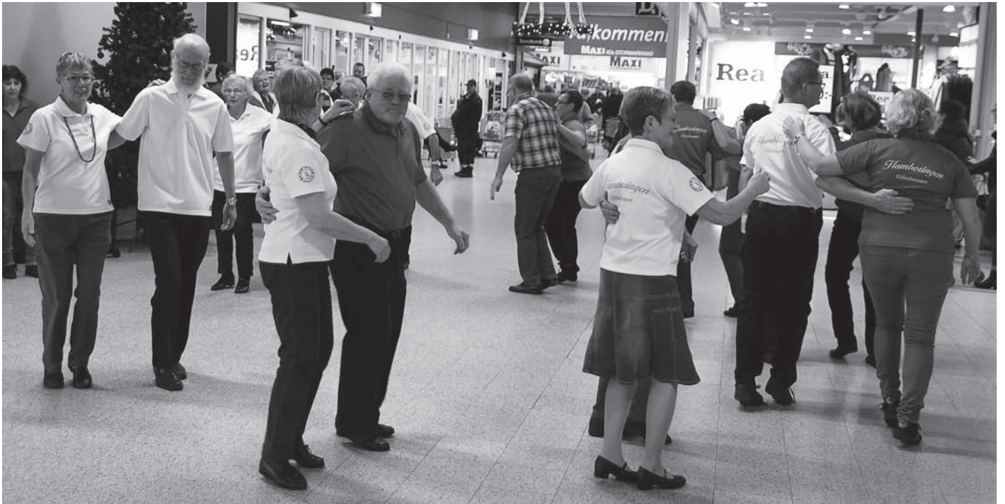
Gilledansgänget visade några grunddanser i kultis vid uppvisningen på köpcentret i Amiralen.

Det var mycket dans på köpcentret Amiralen mitt i ruschen, lördagen den 28 december. Hamboringens linedansare och gilledansarna hade då ett intensivt dans- uppvisningspass mellan kl 11.30-13.30.