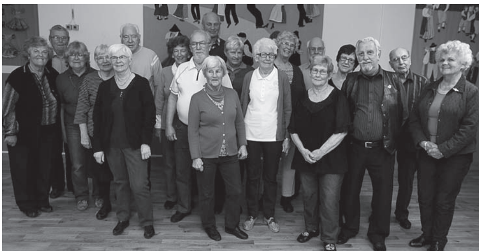
Många kända ansikten finns i 60+ -gruppen. De flesta har dansat i Hamboringen i många år och tycker det är trevligt med samvaron på onsdagseftermiddagarna.