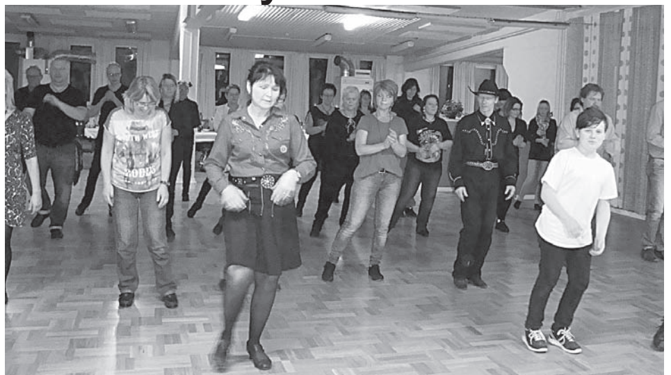
Hamboringens linedansare, Anchorfeet, arrangerade mötet med Sydostalliansen i januari.