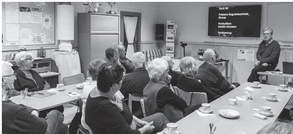
Bosse berättar för intresserade åhörare.

Ett drygt 20-tal medlemmar hade samlats i föreningslokalen för att lyssna på kvällens föreläsare.