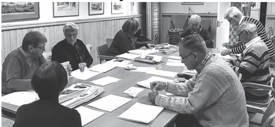
Koncentrerade medlemmar arbetar med utskick av föreningsinformation.

Föreningens tidning Lyckåbladet ges normalt ut med fyra nummer per år.