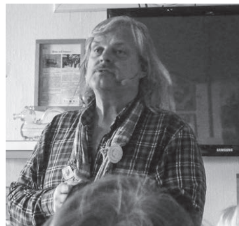
Snacke-Pär snackade inför publiken.

Text: Gudrun Segerstedt o Berit Månsson