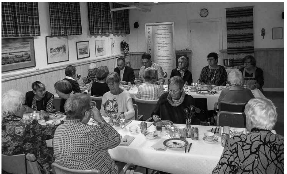
Middagsgästerna låter sig väl smaka!